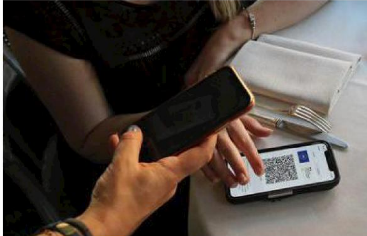
Sur l'application TousAntiCovid, ces personnes vaccinées restent au « 2 sur 2 ». Illustration

Seulement, sur l'application TousAntiCovid, sa situation vaccinale