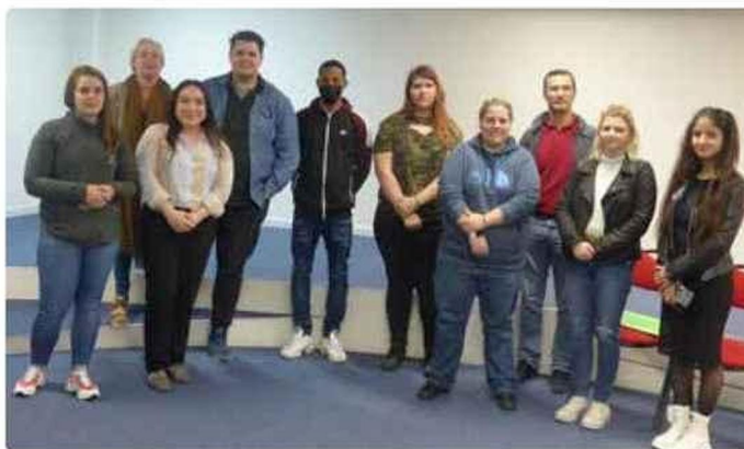
Une partie des lauréats avec les partenaires.